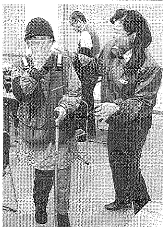
高齢者疑似体験で、重りを入れたベストなどを着用して歩く参加者 — 甲府・県自治会館

県教委は25日、山梨県立勸学院の2012年度の募集について、9学園を6学園に統合し、定員を60人減らして計300人とするを明らかにした。県教委は13年度に学習拠点を甲府と都留に集約し、基本学習費(授業料)も値上げするなど新体制をスタートさせる方針で、移行期間となる来年度入学生に対して周知を徹底するとしている。